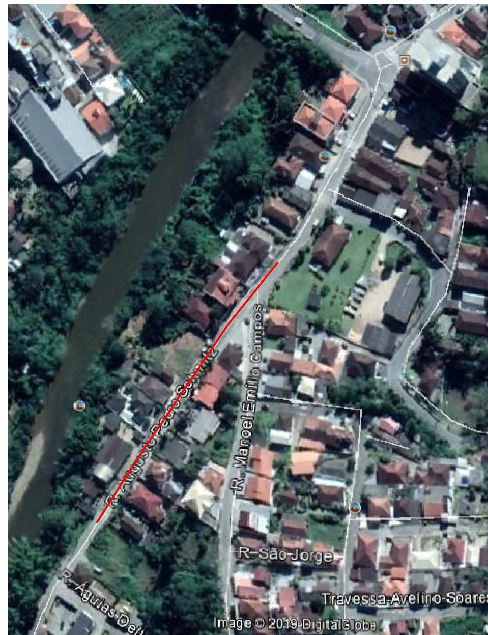
02 SITUAÇÃO s/ escala